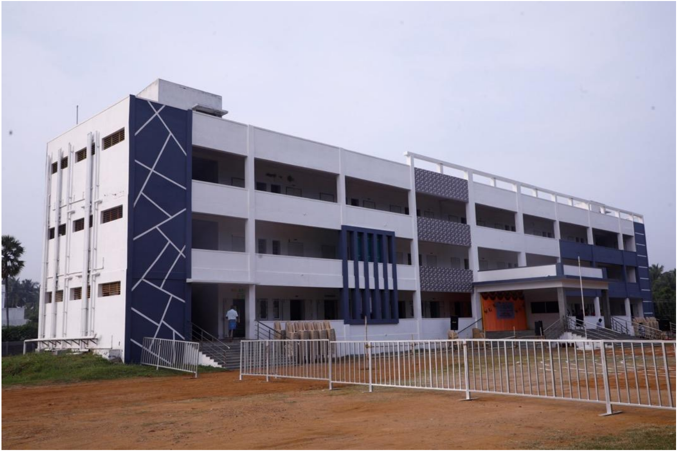
De Crown Matriculation School op de campus Idhaya Sudar, Salem/India.